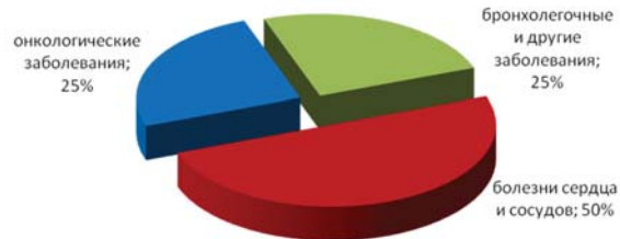
Причины смертей курильщиков

Более 250 соединений табачного дыма токсичны или канцерогены.